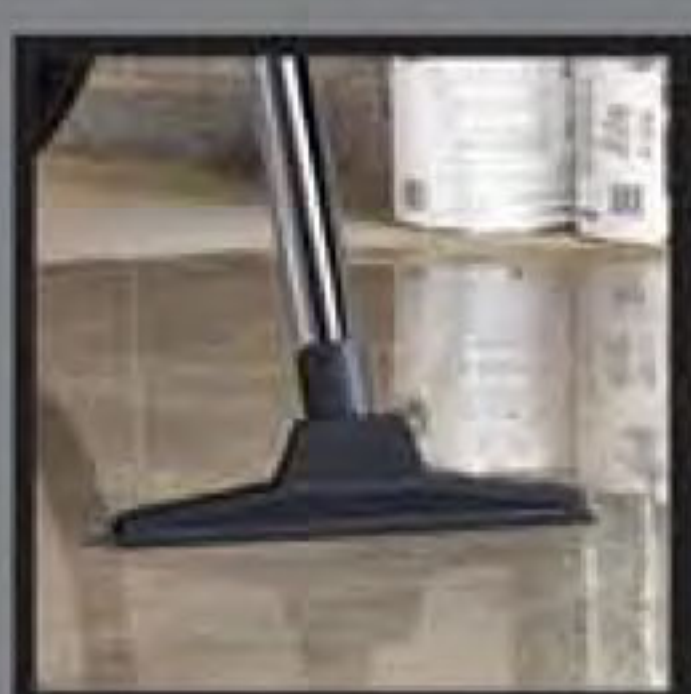
Wet pick up