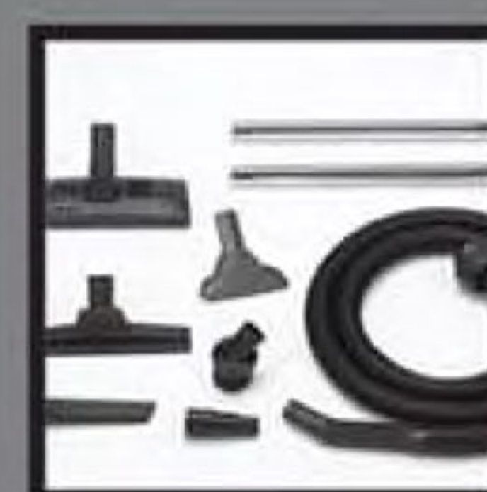
Accessories for wet/dry messes