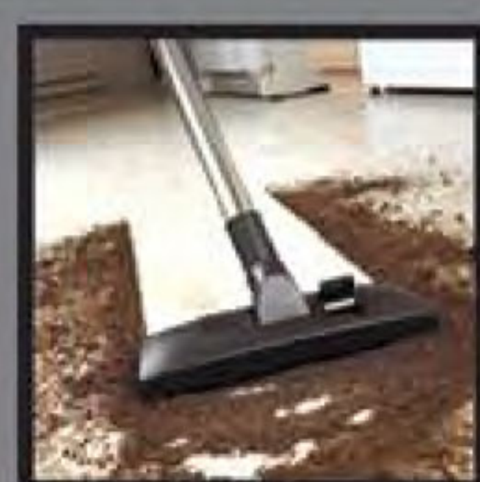
Dry pick up