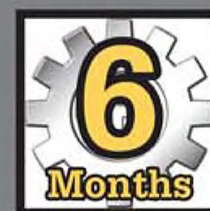
6 months limited warranty